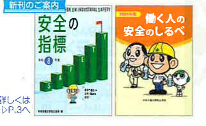
働く人の安全のしるべ No.102 定価880円