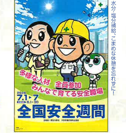
スローガン小D・ヨシだ君 No.145 定価385円