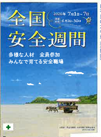
スローガン小A・風景 No.142 定価385円

労働災害防止活動の推進を図り、安全に対する意識と職場の安全活動のより一層の向上に取り組みましょう!