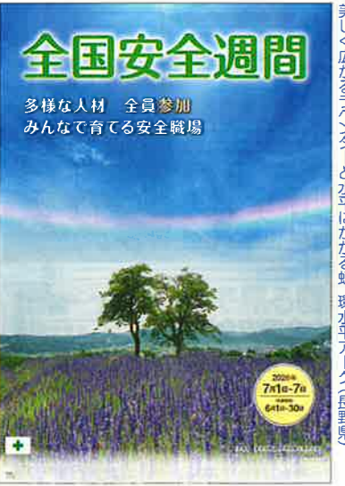
スローガン大 No.141 定価440円