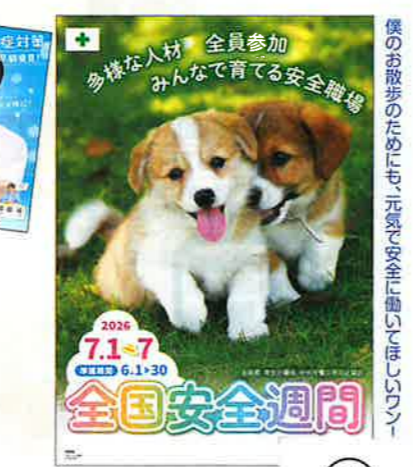
安全の指標 No.101 定価880円